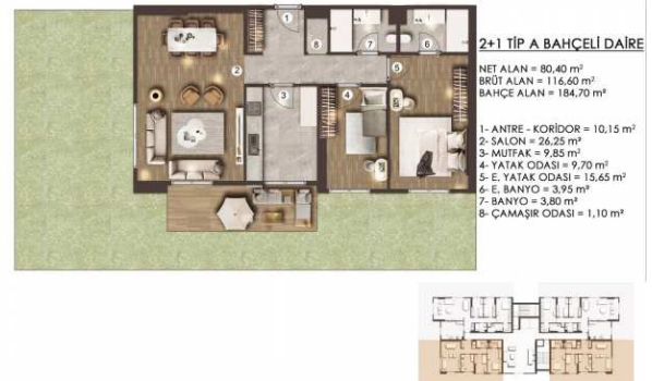
ZEMİN KAT PLANI