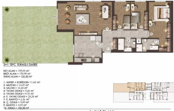
1. KAT PLANI