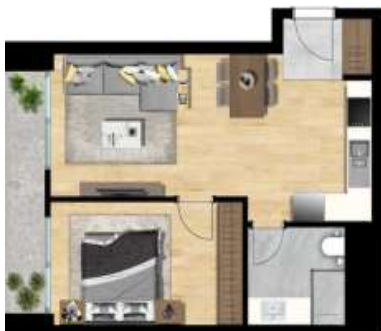
1+1 TİP 4 A BLOK