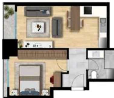
1+1 TİP 1 A BLOK