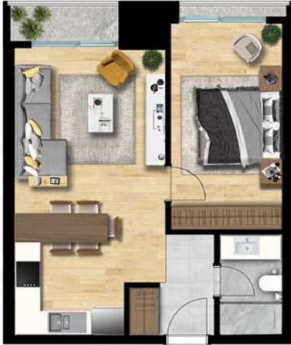
1+1 TİP 3 A BLOK