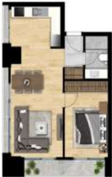
1+1 TİP 5 A BLOK