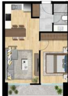
1+1 TİP 2 A BLOK