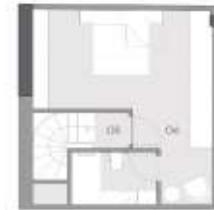
1+1 D KAT