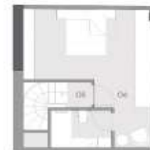
1+1 D KAT