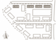
C1 C2 C3 C4 Blok