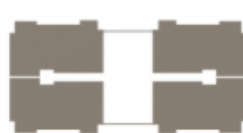
C1 C2 C3 C4 Blok Standart Kat